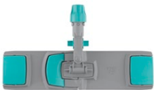
Bastidor Uni System con Block System