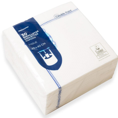
Imagem do pacote