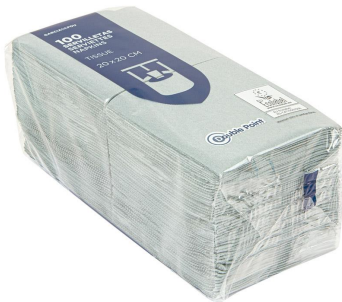
Imagem do pacote

Regulamento (CE) nº 2023/2006 da Comissão Europeia de 22 de dezembro de 2006, sobre boas práticas de fabricação de materiais e objetos destinados a entrar em contato com alimentos.