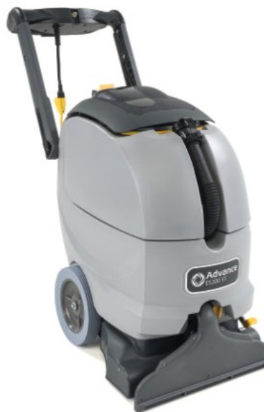
A imagem mostrada pode não representar o modelo orçado

Uma característica conveniente desta máquina é a mangueira de drenagem na parte frontal, que torna o despejo do depósito muito mais simples. O cabeçal da escova auto ajustável cria um maior contacto com a alcatifa e melhora a aspiração, deixando a alcatifa seca depois da limpeza. Por último, o desenho compacto facilita o armazenamento e o transporte da máquina.