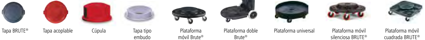
Tapa BRUTE® Tapa acoplable Cúpula Tapa tipo embudo Plataforma móvil Brute® Plataforma doble Brute® Plataforma universal Plataforma móvil silenciosa BRUTE® Plataforma móvil cuadrada BRUTE®