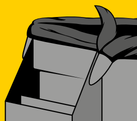
RANURAS DE SUJECIÓN QUE IMPIDEN QUE LAS BOLSAS SE CAIGAN