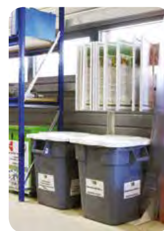
FG9S3000GRAY / FG353900WHT